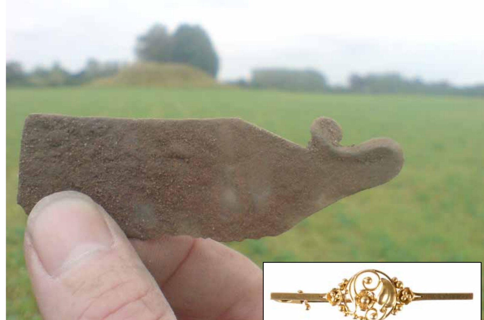
Fig. 7. Helt forståeligt var Claus Jørgensen pavestolt, da han fandt denne ragekniv fra yngre bronzealder, så han sendte straks en MMS med dette illustrative billede. Det indgår nu som dokumentation i museumssagen. Som det fremgår af billedet, fandtes ragekniven ca. 25 m fra en gravhøj, og den stammer sikkert fra en opløjet fladmarksgrav fra tiden omkring 800 f.Kr. Se også fig. 2.