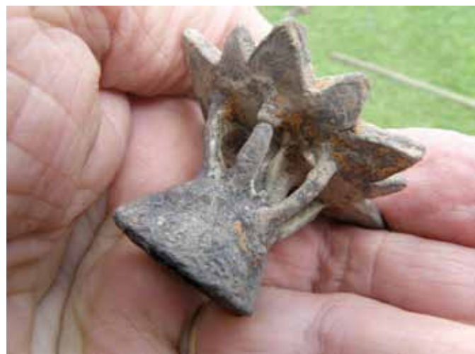
Fig.11 Færdigt bronzeemne med indløbskegle og fordelingskanaler