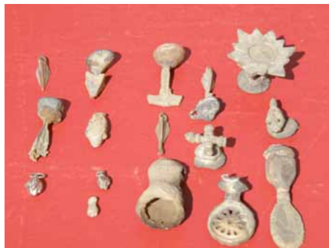
Fig.12 Færdige bronzeemner. De fleste med indløbskegle.

støbe i bronze. Først skulle støbeformene brændes. Et hjulbål blev startet, så formene hele tiden kunne flyttes for at ligge over åbne flammer (fig. 5 og 6). Vokset løb hurtigt ud, og efter 2-3 timer var formene brændte og klar til støbning.