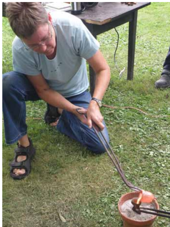
Fig.9. Den flydende bronze hældes i støbeformen