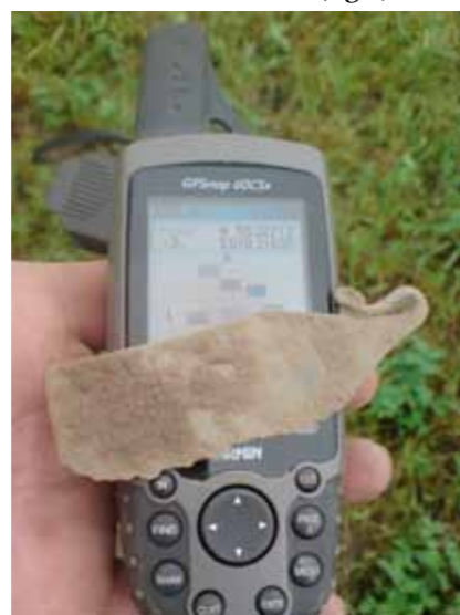
Fig.2. En fremragende måde at dobbeltsikre sine måledata er ved at tage et billede af GPS og genstanden sammen straks efter fremkomsten. Se også fig. 7.

hjælp af indmålingsdata får amatøreren samtidig et spredningskort, som kan sammenholdes med data fra andre personers afsøgning på stedet. Tilsammen kan disse data give et fantastisk overblik over fortidens aktiviteter i landskabet (fig.2).