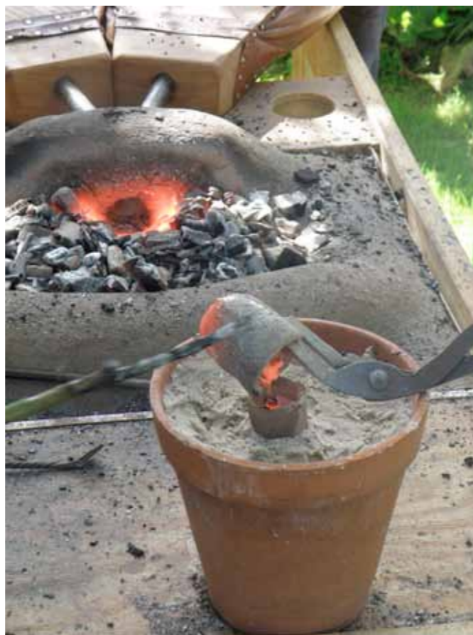
Fig.10. Støbeformen er fyldt